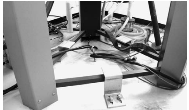
図3 震災で落下したKEK電子陽電子リニアックの四極電磁石。ビームパイプ、真空マニフォールドも破断された

以上より、この装置だけがクエンチにまで至った主因として、防振・免震の機構が他の装置を異なっていたことが考えられる。図3はこの装置の足元を撮影したものであ