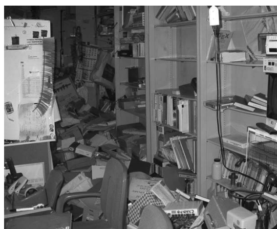
(写真) 地震直後の居室の様子。棚から落下した本などが通路を埋め尽くしている。

未曾有の大震災により、東北地方を中心に東日本は大規模な被害を受けた。これが日本の経済活動にも暗い影を落としている。復旧には多大な時間と労力と資金が必要なのは明白である。大震災からの復興に超伝導技術は貢献できるであろうか、超伝導に関わる研究者としてどのように振る舞えばよいのか、実験ができないこの時期にじっくり考えてみたいと思う。最後に、国内外の超伝導研究者から震災の安否確認や励ましのメールや電話を頂いたことに対して感謝したい。大変嬉しかったし、人と人の繋がりの有り難みを感じることができた。