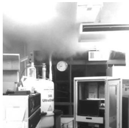
図2 3月11日、20時40分頃に始まった500 MHz NMR装置のクエンチの様子

これらの事実から想像できるのは、最初に受けた強い震動の際に、液体ヘリウムの蒸発量が大きくなって内圧が上昇し、安全弁が開いて外部に漏れ始め、