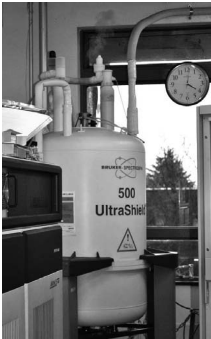
図1 3月11日、16時過ぎにおける500 MHz NMR装置の様子

動画も見せていただいたが、まさに普通のクエンチであった。このNMR装置は外層に液体窒素槽を持つタイプで、当時、液体窒素槽は80～90%、液体ヘリウム槽(容量69リットル)は75～80%満たされていたそうである。運転下限の液体ヘリウムの量は30～40%であり、冷媒が特に不足していたわけではない。